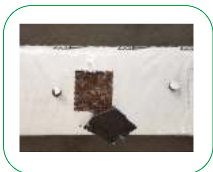
Impronta per cubetto lana di roccia