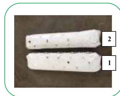
Sacco prima dell'arieggiatura (1) Sacco dopo l'arieggiatura (2)

PER MAGGIORI INFORMAZIONI CONTATTARE L'UFF. TECNICO DI VIGORPLANT: Dott. Agr. Luigi Orlandi ufficiotecnico@vigorplant.it cell. 3939672251 Uffici e stabilimento: via Volta 2 - Fombio (LO) web site: www.vigorplant.it